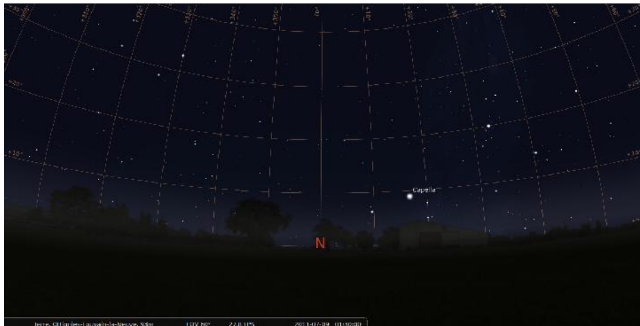
Figure 2 : Capella est présent au nord à moins de 10° d'élévation et une magnitude de 0,05.